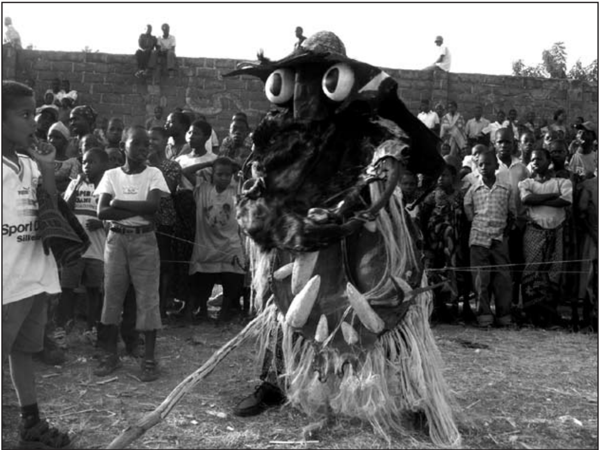
Dragemaskeoptræden på dansepladsen ved Bulabo 2004.