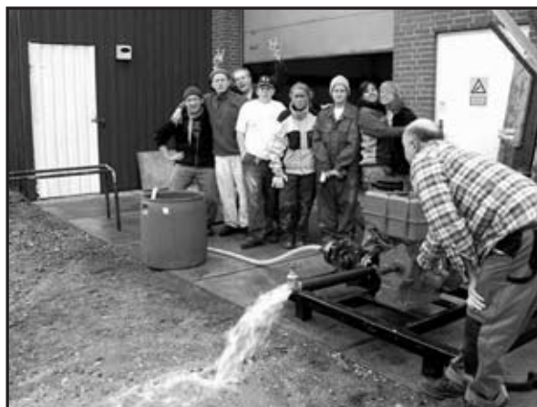
Test afprøvning af et renoveret og opbygget vandpumpe anlæg til Lyako Dance Troup gruppen i landsbyen Lugeye ved Victoriasøen. Utamaduni Kulturforening har på sit julemøde støttet gruppen i Lugeye med kr. 5.000,- til materialerne i forbindelse med opførelse af pumpehuset.