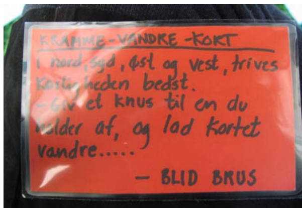
Vandrekortet, som redaktøren modtog.

dårlige undskyldninger, som ”du har noget på kinden”, kan kramme hinanden.