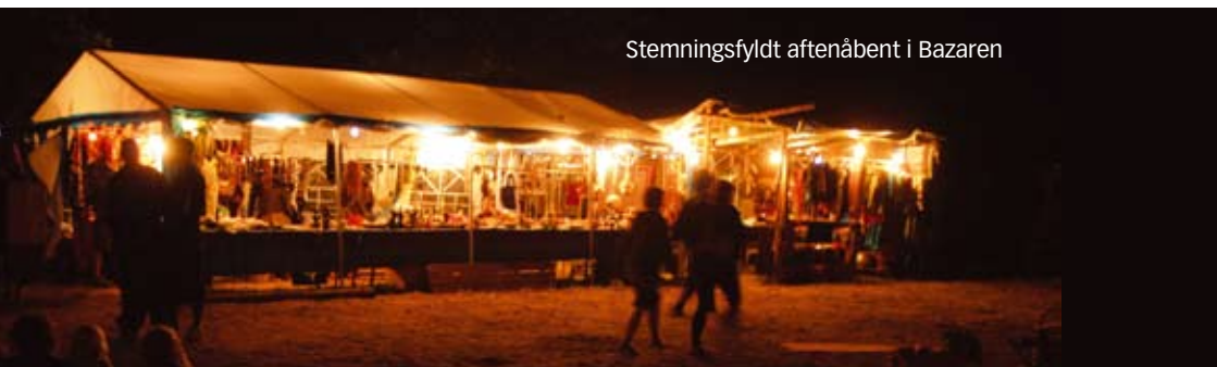
Stemningsfyldt aftenåbent i Bazaren

Alle skal benytte baren til køb af drikkevarer, da vores overskud er dét der gør, at vi kan invitere kulturgæster eller investere i ting til lejren til alles bedste.