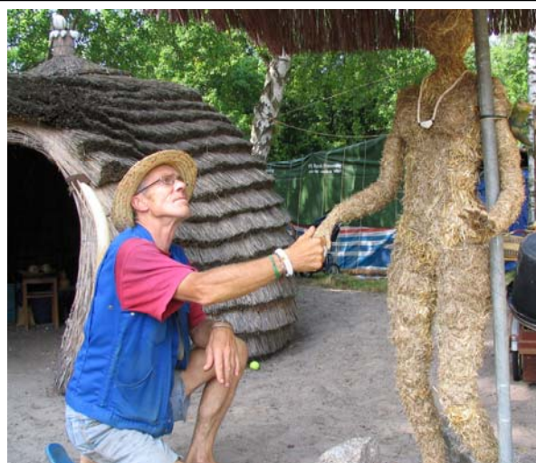
Et sjældent møde mellem to åndsfæller